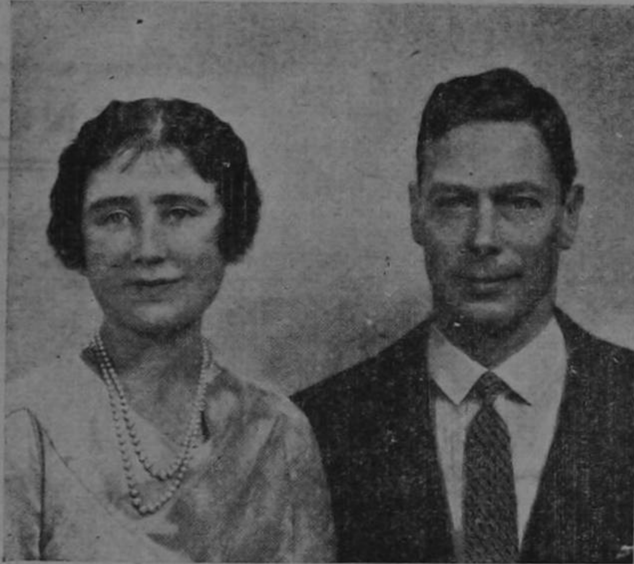
GEORGE VI, King of Great Britain and the Dominions beyond the Seas and Emperor of India with his wife the Queen, Elizabeth.

That evil times have fallen on the dignity of the Royal family of Britain, which may produce serious complications in the Empire, is patent to all.